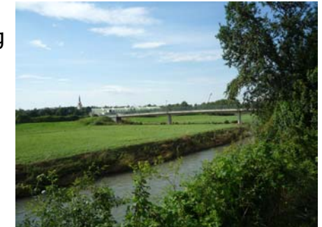
Mitterbachbrücke mit Hundewiese